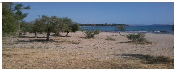
Τμήμα π.Αγίου Δημητρίου Κορωπίου , 6.06. 2018

«Ο Δήμος Κρωπίας τα τελευταία δύο χρόνια έχει απώλεια εσόδων από την μη τοποθέτηση καντινών στην επιτρεπόμενη για τέτοιες μισθώσεις (σ.σ παραχώρηση δικαιώματος απλής χρήσης αιγιαλού και κοινόχρηστης παραλίας) παραλία του Αγίου Δημητρίου. Αυτή η πραγματικότητα έχει επισημανθεί και πέρσι και φέτος προς την Κτηματική Υπηρεσία Αθηνών-Αν.Αττικής και το Υπ. Οικονομικών που ανήκει. Ενημερώνουμε επίσης ότι στον όμορο Δήμο Σαρωνικού λειτουργεί καντίνα με συμφωνητικά διετίας ή τριετίας- ανάλογα που εκμισθώνονται -από τη Ανώνυμη Εταιρία του Δήμου Σαρωνικού. Στο Δήμο Κρωπίας, η Δημοτική Επιχείρηση που υπήρχε το 2007 μετατράπηκε σε Κοινωφελή Επιχείρηση και όχι σε Ανώνυμη Εταιρία. Αυτή η λανθασμένη πολιτική απόφαση της τότε δημοτικής περιόδου αποκλείει τον Δήμο μας από κάθε δράση εκμετάλλευσης καντινών και άλλων δραστηριοτήτων με ανάλογα πολυετή συμφωνητικά μίσθωσης. Γνωστοποιούμε επίσης για άλλη μια φορά ότι στις παραλίες του Δήμου Κρωπίας, από Σκαλάκια Αλθέας έως και την Αγία Μαρίνα έχει απαγορευτεί η τοποθέτηση καντινών, ομπρελών και ξαπλώστρων από την Αρχαιολογική Υπηρεσία καθότι τις έχει χαρακτηρίσει ως απολύτου προστασίας αρχαιολογικές περιοχές (σ.σ Β1 σύμφωνα με το ΦΕΚ 199Δ/2003 Ζ.Ο.Ε). Για τους ανωτέρους λόγους, ο Δήμος Κρωπίας αξιώνει αποζημιώσεις για τα χαμένα έσοδα Δημοσίου και Δήμου».